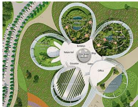
VIZUALIZACE PŘIBLIŽUJÍ INTERIÉR EDENU SILESIA A ŘEZ BUDOVOU.