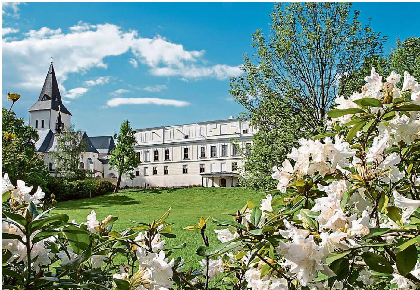
ATRAKCE ZÁMEK FRYŠTÁT I PŘÍLEHLÝ ZÁMECKÝ PARK JSOU HOJNĚ NAVŠTĚVOVANÝMI A OBLÍBENÝMI ČÁSTMI MĚSTA.