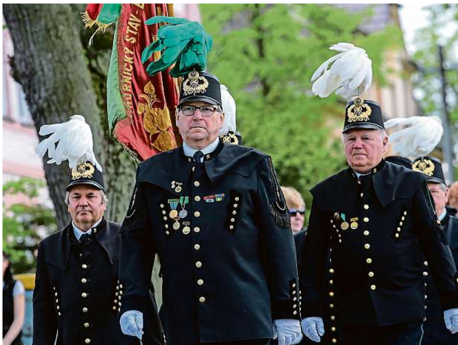
PRŮVOD SOUČÁSTÍ HORNICKÝCH SLAVNOSTÍ JE I PRŮVOD HAVÍŘŮ.

Dobrodružný a romantický příběh se zaměří na krutý osud královského prince, zakutého do železné masky. Ten neměl nikdy spatřit světlo světa, dokud se do toho ovšem nevložili naši staří známí Athos, Porthos, Aramis a d'Artagnan. Podaří se královským mušketýrům navázat stará přátelství a najít odvahu dosadit na královský trůn právoplatného dědice?