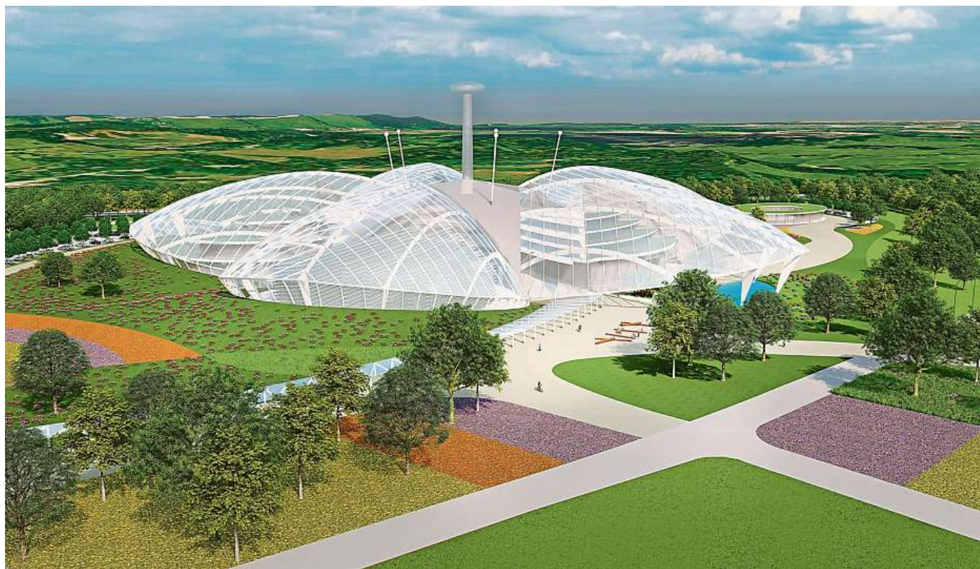
EDEN SILESIA PROJEKT VZDĚLÁVACÍHO A VĚDECKO-VÝZKUMNÉHO PARKU V LOKALITĚ KARVINSKÝCH BROWNFIELDŮ SE INSPIROVAL V ANGLII.

S lezská univerzita zareagovala na výzvu Moravskoslezského kraje, jehož zájmem je vytváření vhodných podmínek pro realizaci velkých strategických projektů, jež v regionu vytvoří nová pracovní místa, napomohou s přechodem k uhlíkově neutrální ekonomice či podpoří obnovu území po těžbě uhlí, podáním hned několika velkých projektových záměrů, které se budou ucházet o dotaci z Operačního programu Spravedlivá transformace. Jejich realizace bude znamenat nejen významné změny na univerzitě samotné, ale hlavně kvalitativní proměnu regionu. Pojďme si dva z nich představit zblízka.