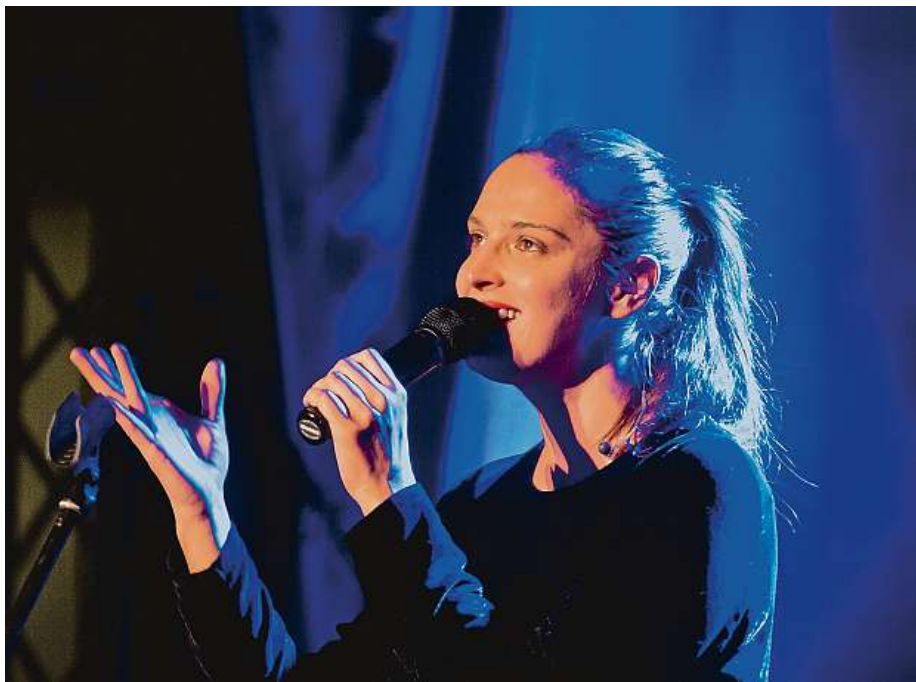
VYSTOUPENÍ JANA KIRSCHNER ZAZPÍVÁ V KARVINĚ 17. ZÁŘÍ.

„Od začátku července bude každý pátek a sobotu promítat naše letní kino, od poloviny srpna bude biograf pod