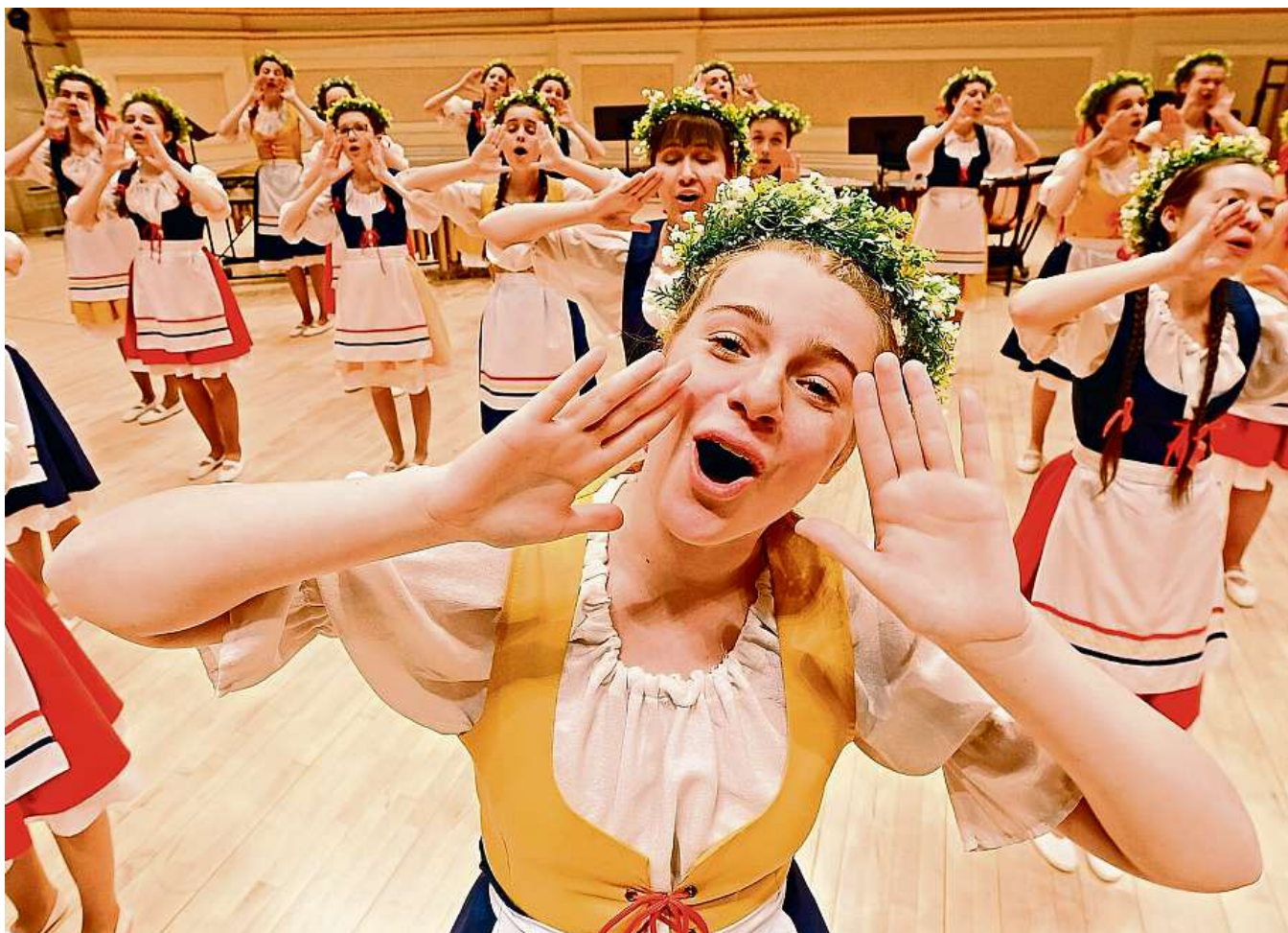
ZLATO POSLEDNÍ VELKÉ VÍTĚZSTVÍ SI PERMONÍK PŘIVEZL Z AMERIKY, KDE ZPÍVAL VE SLAVNÉ CARNEGIE HALL. FOTO: MARTIN STRAKA